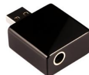
キッコサウンド OKARA oh.1 プレミアムモデル